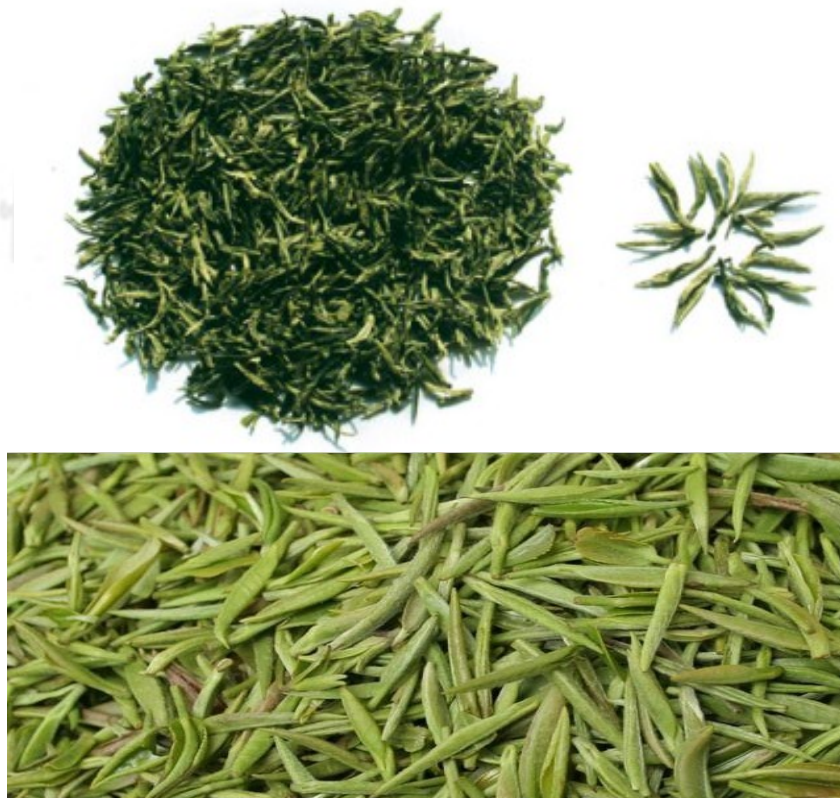
软玉玲珑——信阳毛尖