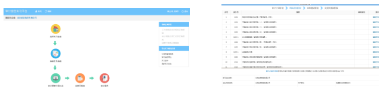
真实工作任务全景化流程角色模拟

采用成果导向、任务驱动组织教学，通过 接受任务、扮演角色、执行流程、填制底稿、判断结论、出具报告 等教学环节，重点让学生 融入角色完成任务 ，体验审计工作流程，提高职业认知感。