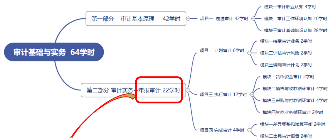
图 1: 《审计基础与实务》项目化课程结构图

《审计基础与实务》课程作为一门职业能力必修课，共 64 学时 4 学分，其课程结构设计按照职业能力培养为重点，重构专业知识，确定教学内容，建立基于审计工作过程系统化，理论知识与实践技能相统合的，以“工作任务”为载体的“项目化”课程结构。具体见图 1。