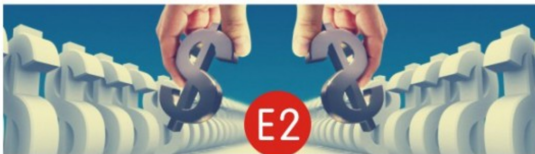
投资活动产生的现金流量