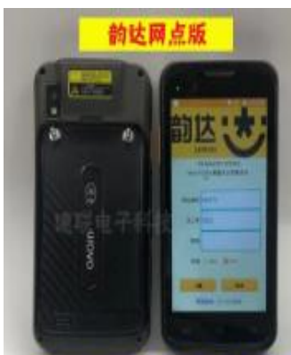
实现数据快速采集的智能终端